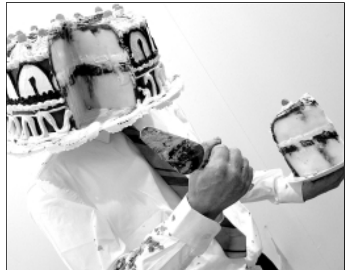
Alguna de las propuestas de este año de la feria.