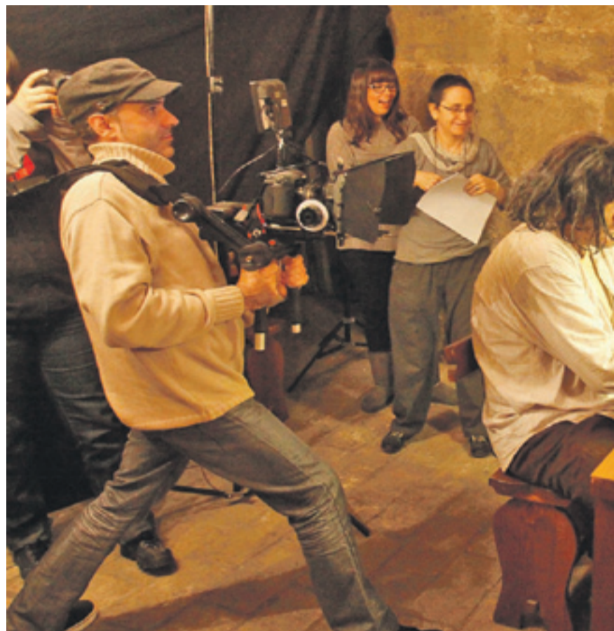
Momento del rodaje del interrogatorio en La Confianza.